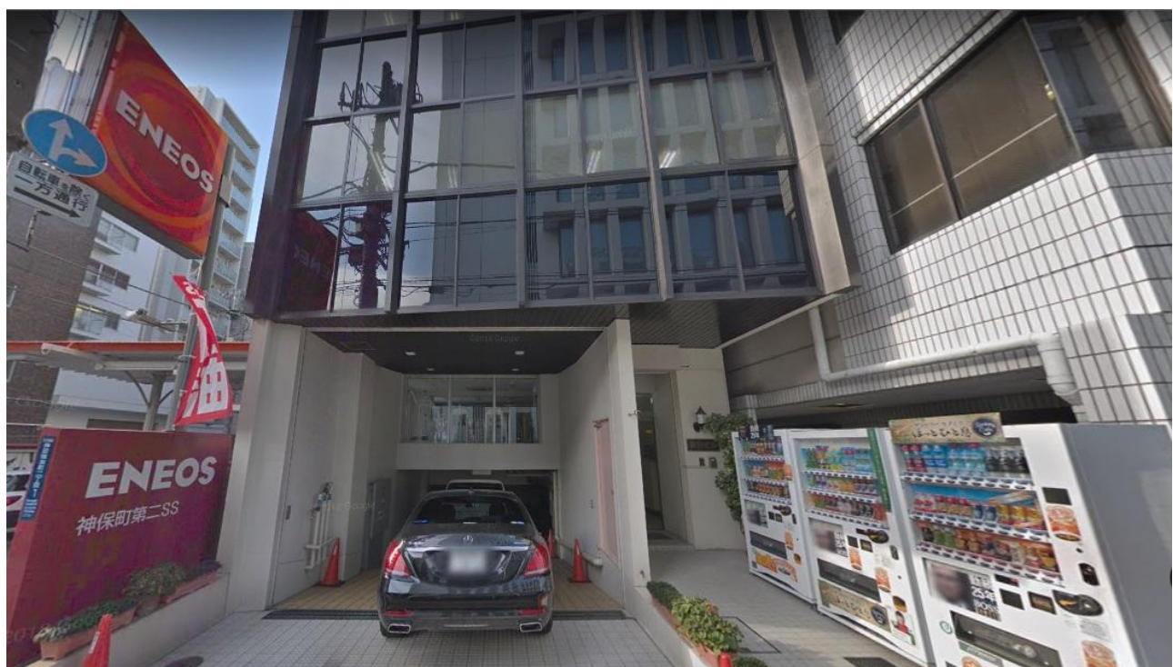
Jネット事務局 / 〒101-0064 東京都千代田区神田猿樂町 2-1-2 鎌形ビル 2階